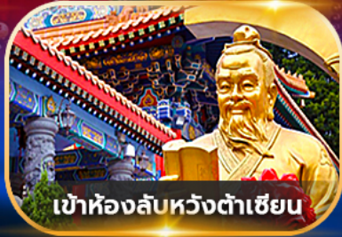
เข้าห้องลับหวังต้าเซียน