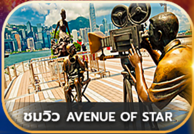
ชมวิว AVENUE OF STAR