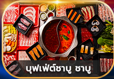
บุฟเฟ่ต์ชาบู ชาบู