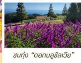
ชมทุ่ง "ดอกบลูซิลเวีย"