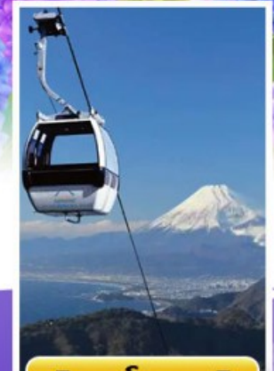
อีซูฟาโนรามาวิว