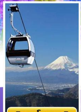
อิซุพานรามาวิว