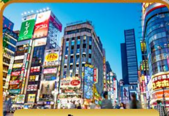
ช้อปบั้งชินจูกุ