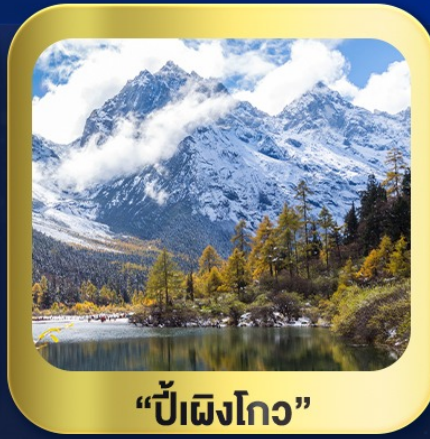
“ปี้เฉิงโกว”