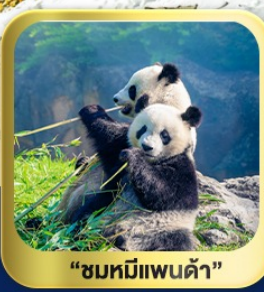
“ชมหมีแพนด้า”