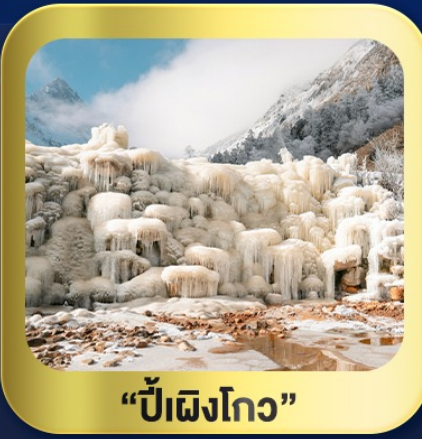
“ปี้เฉิงโกว”

นั่งกระเช้าชมวิว ภูเขาหิมะ-ต้ากู่กลาเซียร์ • ชมความสวยงาม ณ อุทยานปี้เฉิงโกว ห้องสมุดจงซูเก๋อ • ศูนย์หมีแพนด้า • ตงเจียวจี้อี้ • ซอยกว้างชวยແคบ