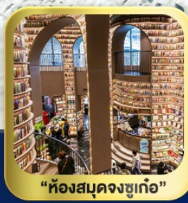
“ห้องสมุดจงซูเก๋อ”