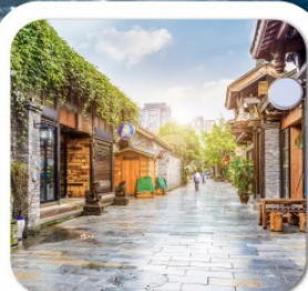
"ชอยกว้างชอยแคบ"