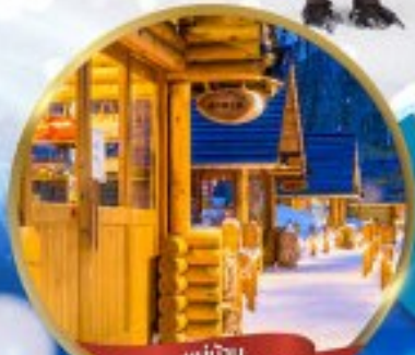
หมู่บ้าน NINGLE TERRACE

สนุกสนาน ณ ลานสกี • หมู่บ้านราเมนอาซาฮิคาว่า • หมู่บ้านนิงเกิลเทอเรส ขบวนพาเหรดเพนกวิน ณ สวนสัตว์อาซาฮิคาว่า • โรงงานช็อกโกแลต โอตารุ • ศาลเจ้าฮอกไกโด • พระใหญ่ HILL OF BUDDHA