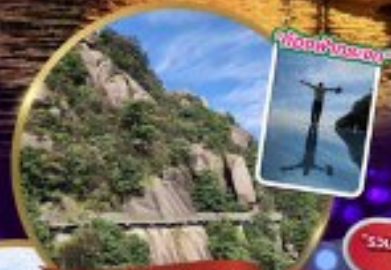
ภูเขาหลิงซาน