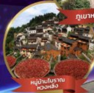
หมู่บ้านโบราณ หวงหลิง