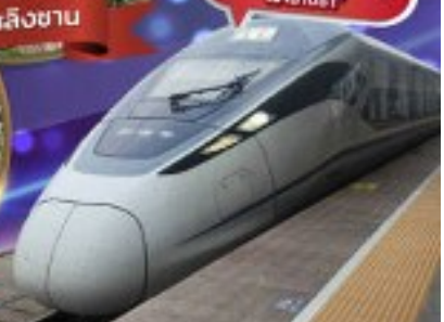
"บริการไฟฟ้าความเร็วสูง เสถียรสุดๆ"