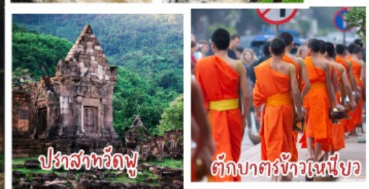
ปราสาทวัดพู