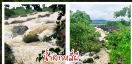
น้ำตกกลลี่ผี