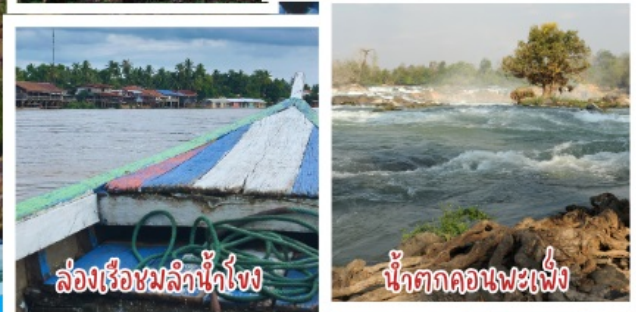
ล่องเรือชมลิวไนร์