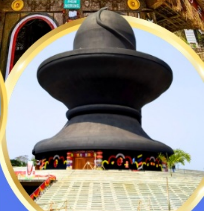
วันมหาฤตยูชัย