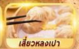
เสี่ยวหลงเปา