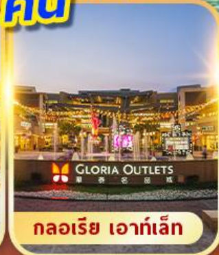
กลอเรีย เอาท์เล็ต