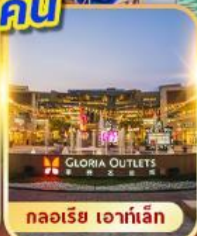
กลอเรีย เอาท์เล็ต