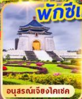
อนุสรณ์เจียงไคเช็ค

เที่ยวเต็ม!! ไข่มุกอันดามัน พักซีเหมินติง 2 คืน