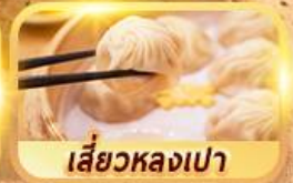
เสี่ยวหลงเปา