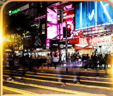
ซ้อปบั้ง Tsim Sha Tsui