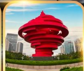
จตุรัสหาลี้