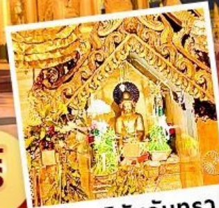
พระสุริยันจันทร