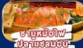
ฟานซีปันไฟ ฟานซีปัน