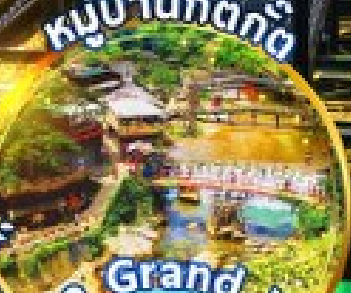
Mega Grand World