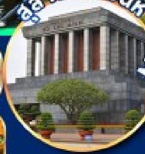
สุสานโฮจิมินห์