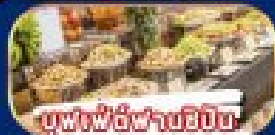
บุนฟู้ฟานซีปัน