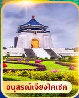
อนุสรณ์เจียงไคเชก