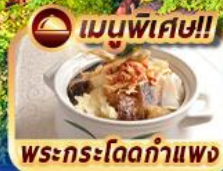
เมนูพิเศษ!! พระกระโดดกำแพง