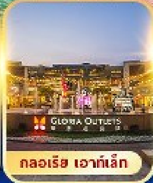
กลอเรีย เอาท์เล็ต