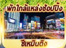
พักใกล้แหล่งช้อปปิ้ง ซีเหมินติง