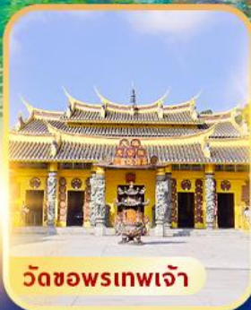
วัดซอพรเทพเจ้า