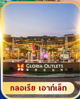
กลอเรีย เอาท์เล็ต