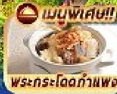
เมนูพิเศษ!!