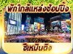
พักใกล้แหล่งช้อปปิ้ง