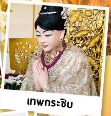
เทพกระซิบ