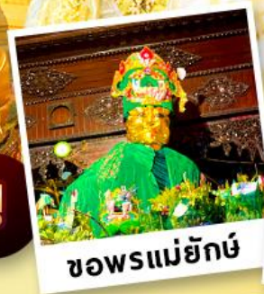
ขอพรแม่ยักย์