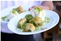
ชิมไอศกรีมตุรกีต้นกำเนิด Nemrut Mountain