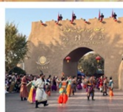
เมืองโบราณคัชการ์