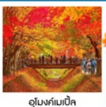
อุโมงค์เมบิล