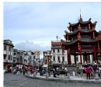
เมืองเก่าชีวเถา