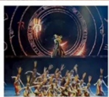
โชว์เว่ยซือ

เซี่ยงไฮ้ คลาสสิก ไนต์ (Shanghai Classic Night) หุบเขาเทวดาวังเซียนกู่ (ชมบรรยากาศกลางวันและกลางคืน) หมู่บ้านโบราณหวงหลิ่ง (รวมกระเช้าไปกลับ) สะพานกระจก ถนนโบราณกุนซี / โชว์การแสดงเว่ยซือ / หมู่บ้านโบราณเฉิงชาน ถนนหวยไห่ (ร้านกระเป๋าสองมอนต์) / เซ็ทเมนู 3 ดักรใหญ่แห่งเซี่ยงไฮ้ Tian An 1,000 Trees / North Bund Green Land / ถนนอู่กิง