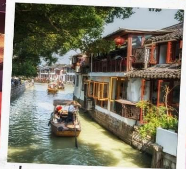
ล่องเรือจูเจียเจี้ยว