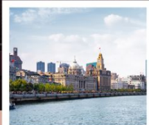
หาดไว่ทาน