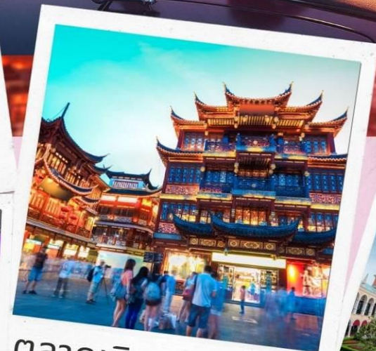
ตลาดเจิ้งหวังเมี่ยว