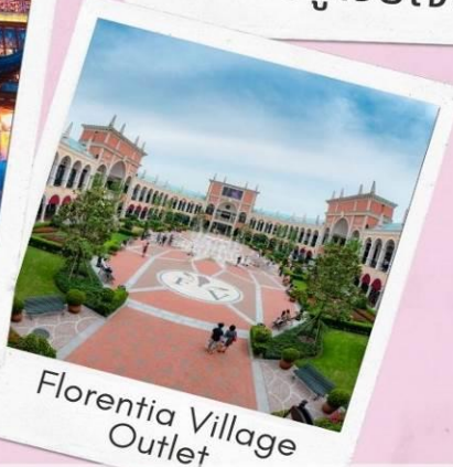
Florentia Village Outlet