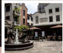
ซินเทียนตี้