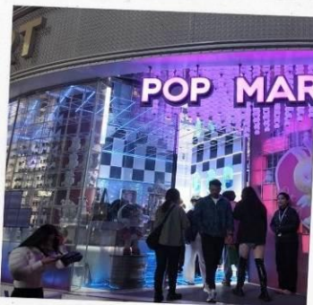
ถนนนานกิง