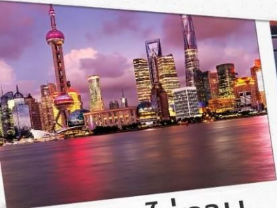
หาดไว่ทาน