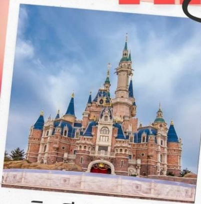
ดิสนีย์แลนด์