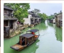
หมู่บ้านจูเจียเจียว