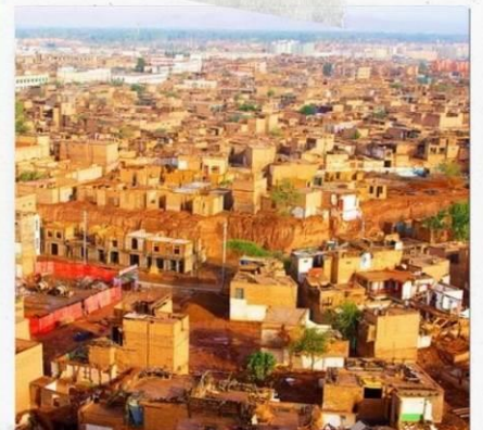
เมืองคาสือ