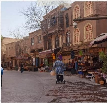
เมืองไบรณคัซการ์