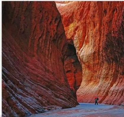
แกรนด์แคนยอน เทียนชาน