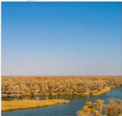
สวนต้นหุหยาง