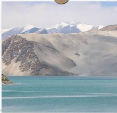
ทะเลสาบไ้ซาหุ