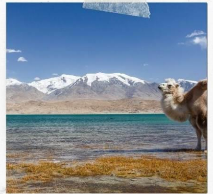
ทะเลสาบคาลาคู่เล่อ