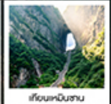
เวียงหนินชาน

ทรนดักกอน / สพานกั๋วไท่กว๋อ / เขาคิโยหนินชาน / เรือชิงไถ่ / ประตูสวรรค์ / ไร่บงจิ้งจกต๋อหวง / เขาคิโยหนินชาน สวนจอนเฟยเต๋อหวง / ทาฟวาทกราย / เมืองฟูหลงเจิน / ล่องเรือตามลำน้ำต๋อเจียง / เขามือโบราณฝ่งหวงยกทำกิน