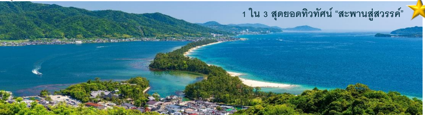
1 ใน 3 สุดยอดทิวทัศน์ "สะพานสู่สวรรค์"