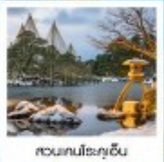
สวนเทนมึโรกุเอ็น