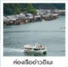
ค่องเรือฮ่าวฮิเมะ