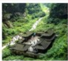
หลุมฟ้า สะพานสวรรค์

พระพุทธรูปทะเลสาบ / หมู่บ้านโบราณผิงตี้เป่ อุทยานหลุมฟ้าสะพานสวรรค์ / เรือมังกร / อุทยานนกนางพิน ภูเขาโมโก / Wulong Flying Kiss / เข็มปักถนนหนวดเขี้ยวฟางเปีย เข็มปักหงหยาดัง / มหาศาลประชาชน / เข็มปักไฟฟ้าตึก ถนนโบราณจีนแท้ / ศูนย์หมีแพนด้า