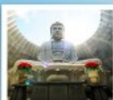
เบ็นเนะพุทธรูปเจ้า