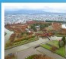
โทริยิวะกะ ทาวเวอร์

หุบเขานรกจิกะคุตามิ / โถงถ้ำฮังโงะคานิมิชิ ตลาดเช้าเมืองฮาโกดาเตะ / โทริยิวะกะ ทาวเวอร์ ภูเขาไฟอุสุ / จุดชมวิวยุซึกิ / ค่องเรือชมทะเลสาบโทบะ สวนอุซุมิโนะ / สวนพฤกษศาสตร์ / เก็บผลไม้ / สัมผัสน้ำพุร้อน พิพิธภัณฑสถานแห่งชาติ / นาฬิกาไอน้ำโบราณ / โรงเบียร์โทบะ เบ็นเนะพุทธรูปเจ้า / ถนนฮิโอบังทาบูกิโกจิ / ย่านฮูซุกิโนะ