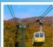
ภูเขาไฟอุสุ