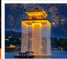
อุ้มี่โจว

หมู่บ้านσύม่อซ่างเหอ / อุ้มี่โจว ล่องเรือชมแสงสียามค่ำคืน หมู่บ้านโบราณหวงหลิ่ง / สะพานกระจก / เขาหลิงซาน / กระจกแห่งท้องฟ้า หุบเขาเกอว้างเซียนกู่ / ล่องเรือทะเลสาบซีหู / ถนนคนเดินเหอฟางเจีย