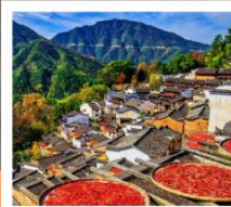
หมู่บ้านหวงหลิ่ง