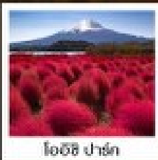
โฮชิโนะ ฟูจิ