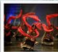
โรว์ฟิวด