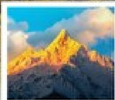
ภูเขาหิมะเท๋นเป่ย์