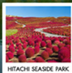
HITACHI SEASIDE PARK