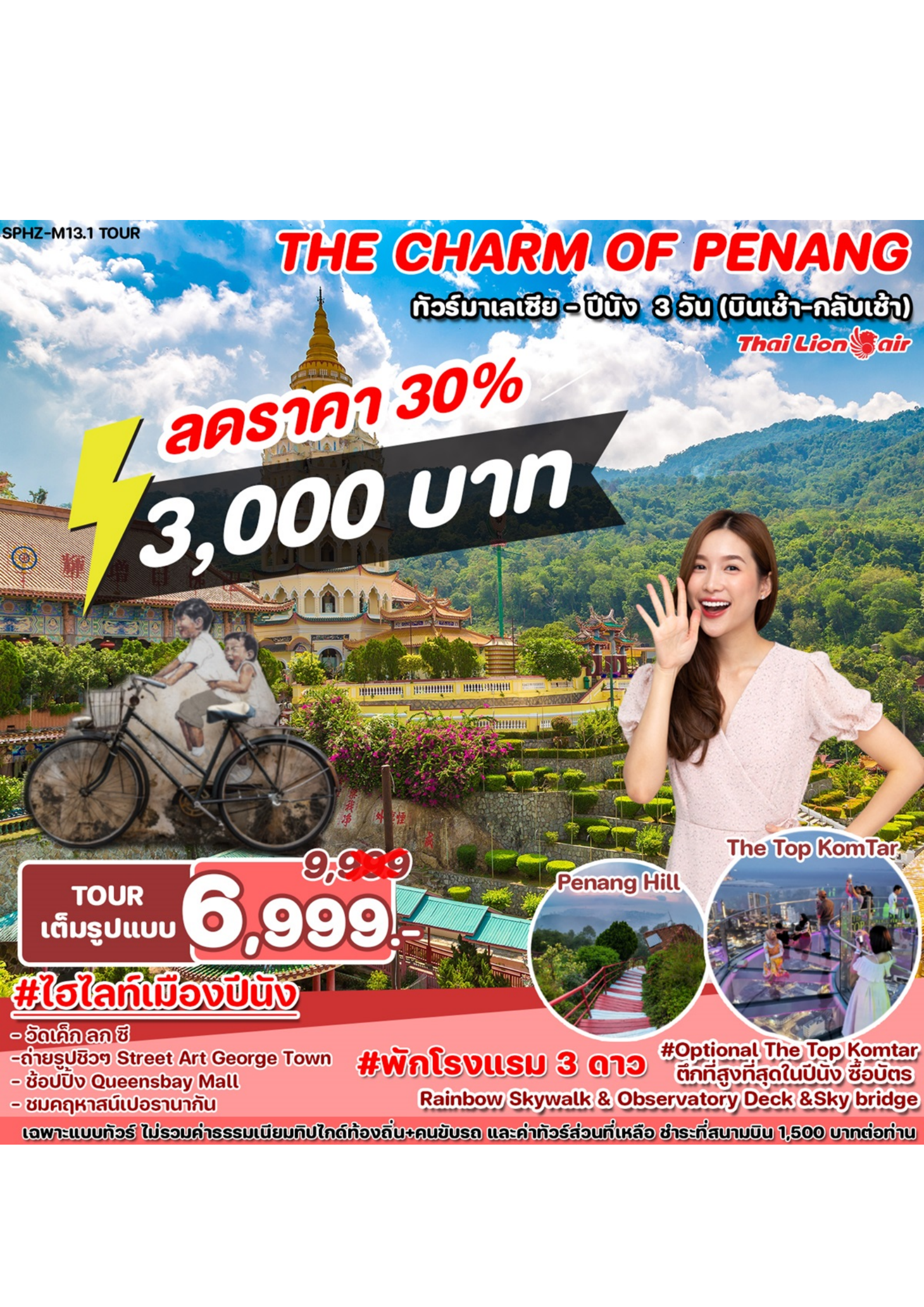
The Top KomTar