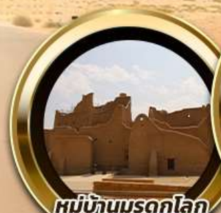
หมู่บ้านมรดกโลก ดิริยาฮ์ AlDiriyah

บินหรู อยู่สบาย เทียบชิดด์ ชิลด์ 10 ท่าน คอนเฟิร์มเดินทาง