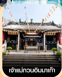
เจ้าแม่กวนอิมมาเก๊า

✈️ คอนเฟิร์มออกเดินทาง ✈️ ทุกพีเรียด 2 ท่านขึ้นไป