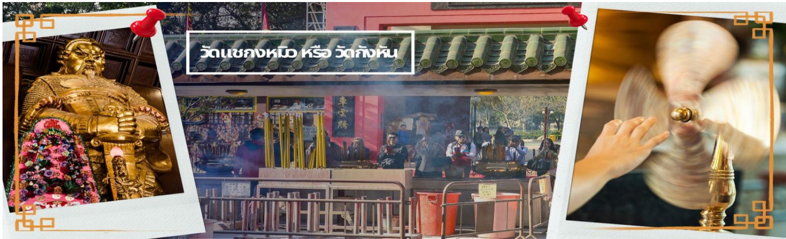
วัดเข่งหม้อ หรือ วัดกั๊กหัน

จากนั้นเดินทางสู่แหล่งช้อปปิ้ง ย่านจิมซาจуй (TSIM SHA TSUI) สัมผัสบรรยากาศร้านเสื้อผ้า ร้านอาหาร และร้านขายเครื่องประดับที่แข่งกันเรียกลูกค้าตลอดแนวถนนที่มีทั้งสินค้าหรูหราและอุปกรณ์อิเล็กทรอนิกส์ ตั้งอยู่บนถนนนาธาน ถนนทอดยาวตั้งแต่ จิมซาจуй จนถึงย่าน ปรีนซ์เอ็ดเวิร์ด เต็มไปด้วยร้านค้าต่างๆมากมายทั้งเสื้อผ้าแบรนด์เนมระดับ HI-END ชื่อดังทั่วโลก ห้างสรรพสินค้าที่ทันสมัย จากถนนนาธานไปที่ถนนแคนตัน ท่านจะตื่นตาตื่นใจไปกับเอาท์เล็ตแบรนด์ที่เรียงติดกันเป็นแถบ นอกจากนี้ยังมี HARBOUR CITY ศูนย์การค้ายักษ์ใหญ่ของฮ่องกง ซึ่งมีร้านค้ากว่า 450 ร้านรวมอยู่ที่นี้ และมี SHOPPING COMPLEX ขนาดใหญ่ชื่อ OCEAN TERMINAL ซึ่งประกอบไปด้วยห้างสรรพสินค้าเรียงรายกันอยู่และมีทางเชื่อมติดต่อกันสามารถเดินทะเลถึงกันได้ให้แบรนด์ดังมากมายให้ท่านได้เลือกซื้อ หรือจะชมวิวของอ่าววิกตอเรีย เดินเล่นบริเวณใกล้ๆ จิมซาจуйเริ่มต้นจากหอนาฬิกาสมัยอาณานิคม แถวนี้มีทัศนียภาพที่สวยงามที่สุดแห่งหนึ่งสำหรับการชมวิวตามแนวท่าเรือของเกาะฮ่องกง เป็นตัวเลือกให้ท่านไปเยี่ยมชมอีกด้วย สมควรแก่เวลานำคณะออกเดินทางสู่สนามบินฮ่องกง