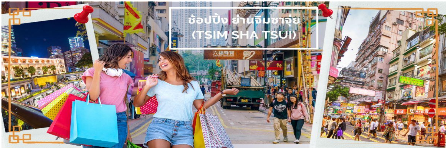
ช้อปปิ้งย่านจิมซาจуй (TSIM SHA TSUI)

จากนั้นเดินทางสู่แหล่งช้อปปิ้ง ย่านจิมซาจуй (TSIM SHA TSUI) สัมผัสบรรยากาศร้านเสื้อผ้า ร้านอาหาร และร้านขายเครื่องประดับที่แข่งกันเรียกลูกค้าตลอดแนวถนนที่มีทั้งสินค้าหรูหราและอุปกรณ์อิเล็กทรอนิกส์ ตั้งอยู่บนถนนนาธาน ถนนทอดยาวตั้งแต่ จิมซาจуй จนถึงย่าน ปรีนซ์เอ็ดเวิร์ด เต็มไปด้วยร้านค้าต่างๆมากมายทั้งเสื้อผ้าแบรนด์เนมระดับ HI-END ชื่อดังทั่วโลก ห้างสรรพสินค้าที่ทันสมัย จากถนนนาธานไปที่ถนนแคนตัน ท่านจะตื่นตาตื่นใจไปกับเอาท์เล็ตแบรนด์ที่เรียงติดกันเป็นแถบ นอกจากนี้ยังมี HARBOUR CITY ศูนย์การค้ายักษ์ใหญ่ของฮ่องกง ซึ่งมีร้านค้ากว่า 450 ร้านรวมอยู่ที่นี้ และมี SHOPPING COMPLEX ขนาดใหญ่ชื่อ OCEAN TERMINAL ซึ่งประกอบไปด้วยห้างสรรพสินค้าเรียงรายกันอยู่และมีทางเชื่อมติดต่อกันสามารถเดินทะเลถึงกันได้ให้แบรนด์ดังมากมายให้ท่านได้เลือกซื้อ หรือจะชมวิวของอ่าววิกตอเรีย เดินเล่นบริเวณใกล้ๆ จิมซาจуйเริ่มต้นจากหอนาฬิกาสมัยอาณานิคม แถวนี้มีทัศนียภาพที่สวยงามที่สุดแห่งหนึ่งสำหรับการชมวิวตามแนวท่าเรือของเกาะฮ่องกง เป็นตัวเลือกให้ท่านไปเยี่ยมชมอีกด้วย สมควรแก่เวลานำคณะออกเดินทางสู่สนามบินฮ่องกง