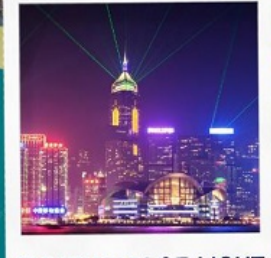
SYMPHONY OF LIGHT