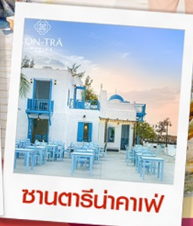
ชานตารีน่ากาแฟ