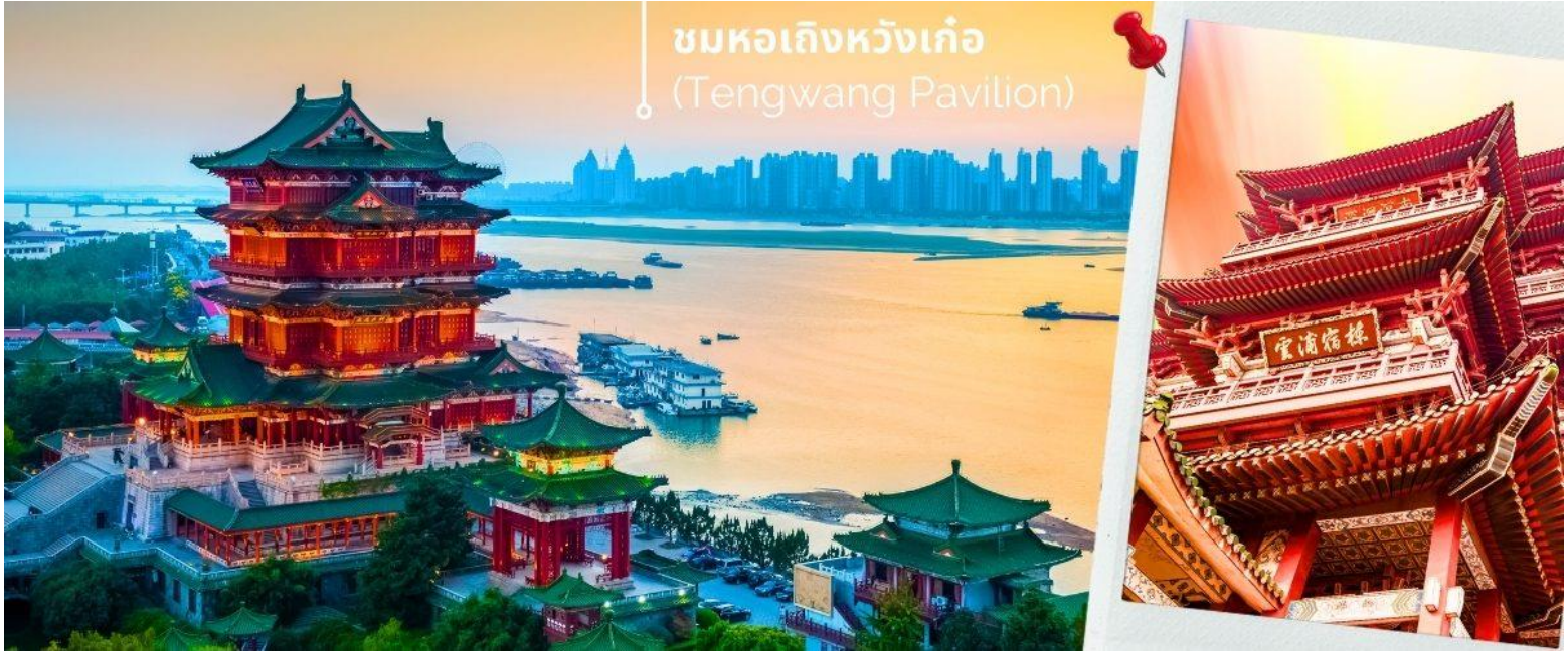
ชมหอเกิ่งหวังเก้อ (Tengwang Pavilion)

ด้วยบทกวีและภาพฝาผนังสมัยราชวงศ์ถังและอื่นๆ 1 ใน 3 หอที่มีชื่อเสียงที่สุดในเมืองจิ้นหอสอง 9 ชั้น ริมฝั่งแม่น้ำกั้นเจียง ทางตะวันตกเฉียงเหนือของนครหนานซาง