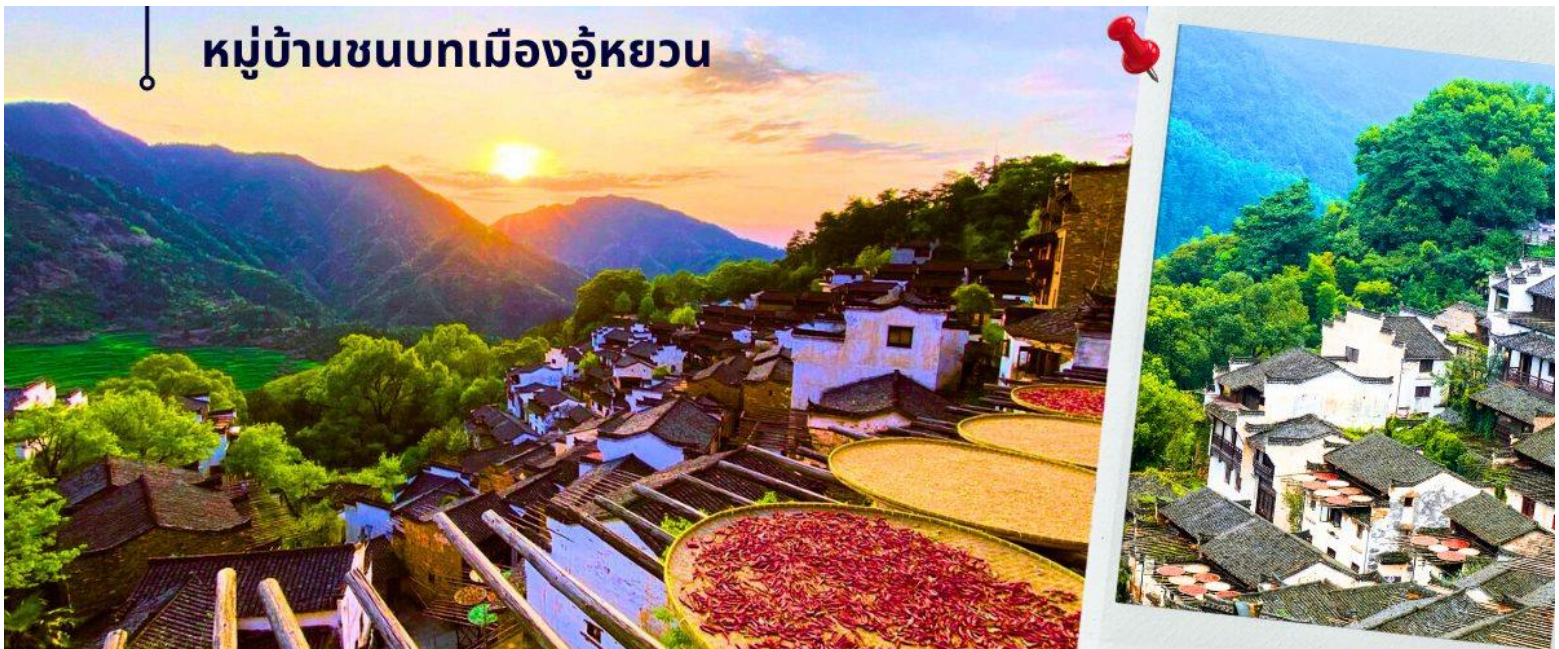
หมู่บ้านชนบทเมืองอู่หยวน

นำท่านเดินทางสู่ หมู่บ้านชนบทเมืองอู่หยวน ใช้เวลาเดินทางประมาณ 1.30 ชั่วโมง “เมืองชนบท ที่งดงามที่สุดของประเทศจีน” เป็นเมืองที่ธรรมชาติกลมกลืนกับวิถีชาวบ้านที่เป็นอยู่อย่างเรียบง่ายได้อย่างลงตัว บ้านเก่าแก่ที่อนุรักษ์ไว้อย่างดี สีสันความงามจากธรรมชาติหมุนเวียนไปตามฤดูกาล ทำให้นักท่องเที่ยวได้สัมผัสบรรยากาศที่แตกต่างกันออกไป ตามแต่ฤดูที่มาเยือนเมืองอู่หยวนแห่งนี้ ซึ่งชาวบ้านยังคงใช้ชีวิตอย่างเรียบง่าย ใช้ชีวิตสบายๆ ริมสายน้ำ ในพื้นที่สีเขียวที่โอบล้อมด้วยภูเขา ด้วยความห่างไกลเมือง และข้อจำกัดเรื่องการเดินทางเข้าถึงในสมัยก่อน ช่วยปกป้องให้อู่หยวนยังคงรักษาธรรมชาติและวิถีชีวิตแบบดั้งเดิมไว้ได้ แม้ว่าปัจจุบันการเดินทางมาที่อู่หยวนจะสะดวกสบายขึ้นมาก และการพัฒนายังเข้าถึงทุกหมู่บ้าน แต่โชคที่ผู้คนได้เรียนรู้แล้วว่า พวกเขาไทยหาและยังต้องการให้มีหมู่บ้านที่มีบรรยากาศแบบนี้อยู่ต่อไป ดังนั้น อู่หยวนจึงยังคงความบริสุทธิ์อยู่ได้ ภายใต้กระแสการพัฒนาสมัยใหม่ของจีน