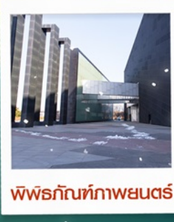
พิพิธภัณฑ์ภาพยนตร์