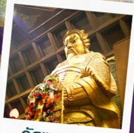
วัดเขาภุมมิม