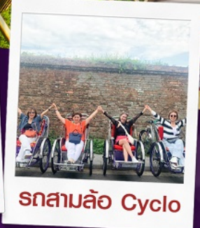
รถสามล้อ Cyclo