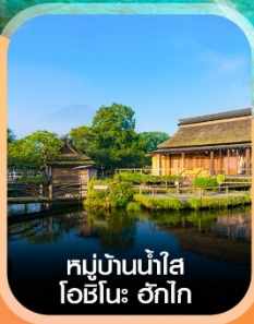
หมู่บ้านน้ำใส โอชิโนะ ฮักไก