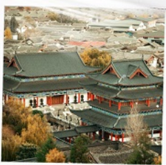
เมืองเก่าลี่เจียง