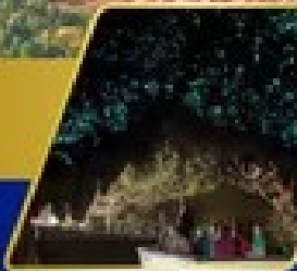
ตำนานของเรื่องแสง