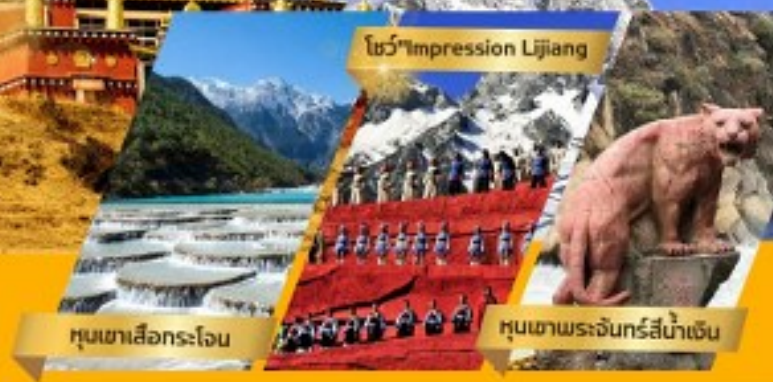
โชว์ "Impression Lijiang"