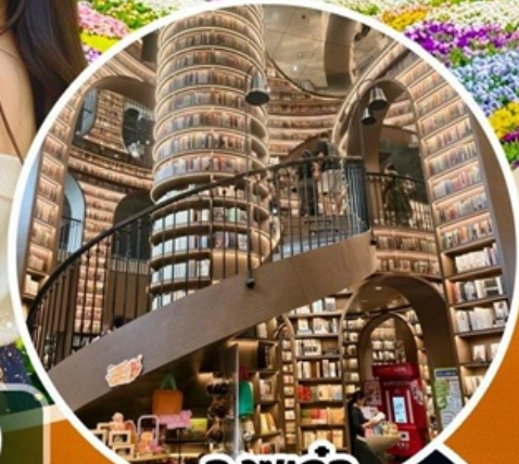
จางชู่เก๋อ