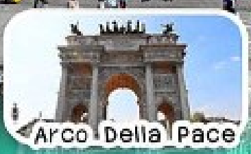
Arco Della Pace