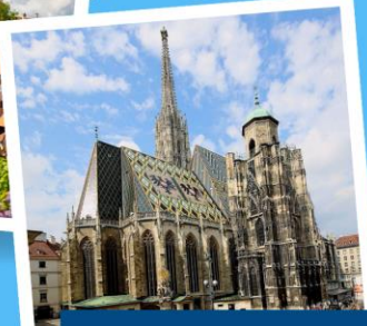
มหาวิหารแมททีอัส

เยอรมนี ออสเตรีย เชก สโลวาเกีย ฮังการี 11 วัน 8 คืน