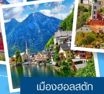
เมืองฮอลสตัดท์