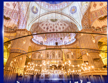
เข้าชมความงามสุเหร่าสำน้ำมิน